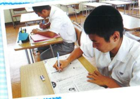
小論文指導 推薦入試対策