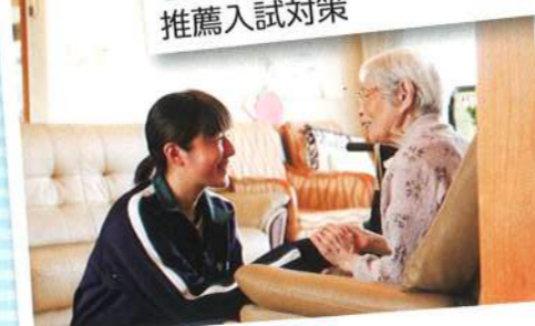
介護キャリア教育 高齢者との交流