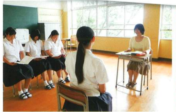
面接練習 本番さながらの指導