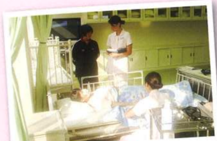
看護キャリア教育 看護学校と連携