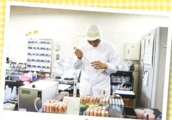
インターンシップ 「働く」ことの意義を考える