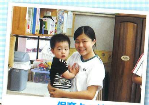
保育キャリア教育 乳幼児とのふれあい