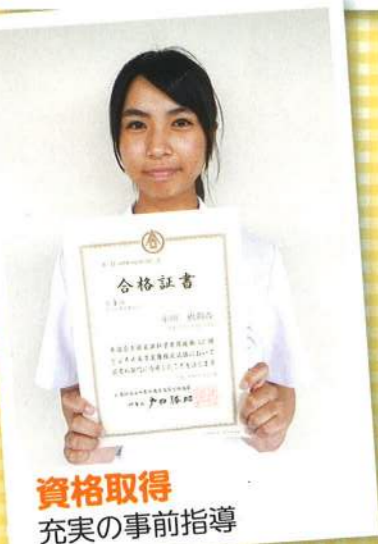
資格取得 充実の事前指導