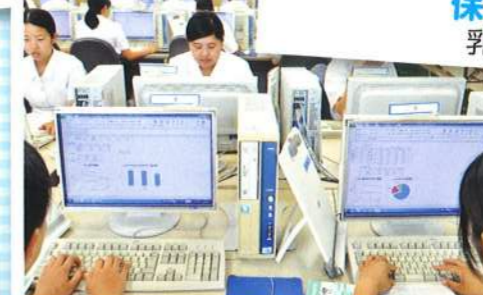
選択授業 「学ぶ」意欲を引き出す